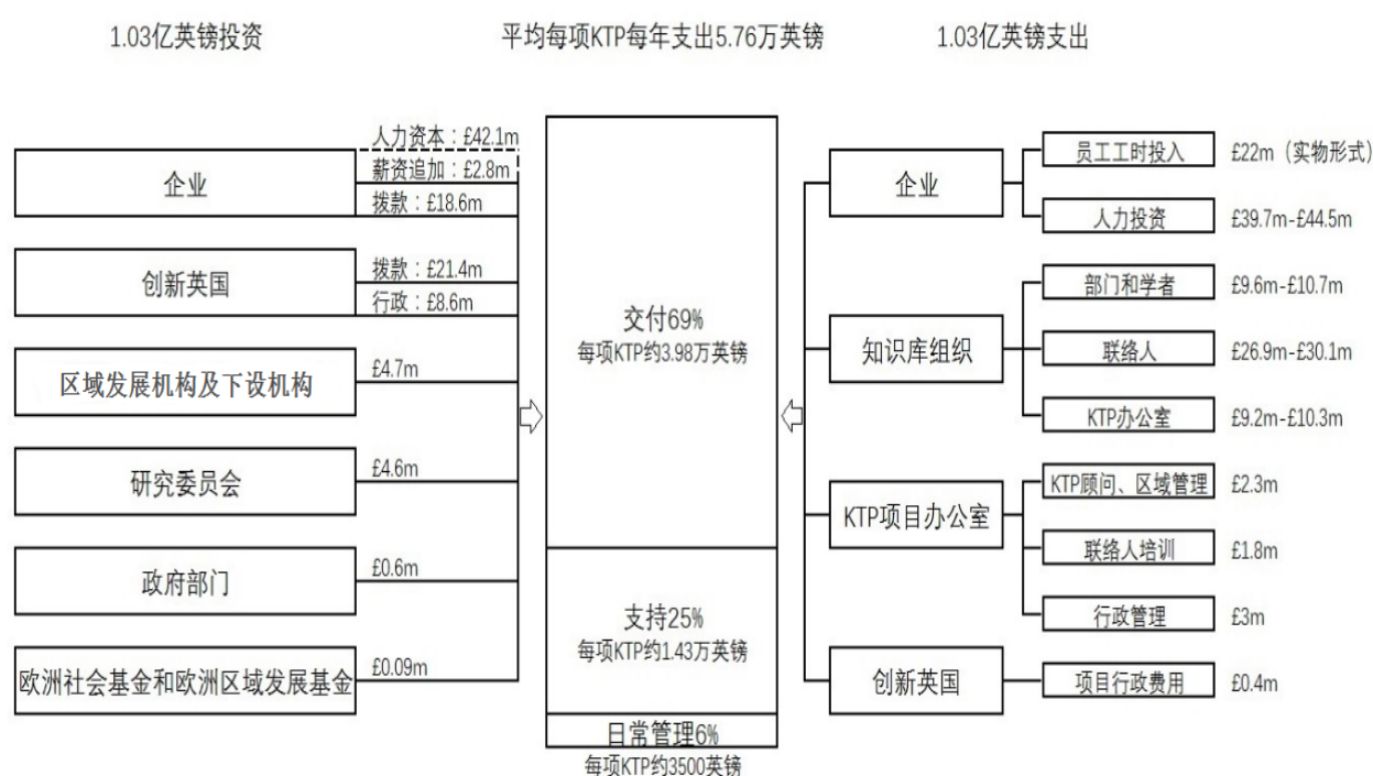
图 3 2008 年度 KTP 项目资金流向

资料显示（图 3），2008 年度 KTP 项目资金共 1.03 亿英镑，主要由企业和创新英国提供（超过 90%）。资金三大去向：项目交付（69%）、项目支持（25%）和项目日常管理（6%），覆盖企业、知识库、 KTP 项目办公室和创新英国的各类支出。 KTP 运行过程中，所有财务支出需当地管理委员会批准，连同 KTP 顾问的书面同意书记录在案，每季度以正式文件形式申请拨款。 KTP 拥有完善的财务审查机制，要求项目申报时上交完整的原始票据，注明责任人、发生时间、获批时间和相应会议记录。